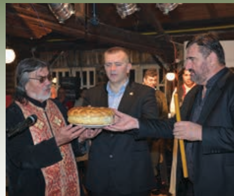
03.05.2014. године Сремски Карловци – СЛАВА НАРОДНОГ ПОКРЕТА ДИНАРА-ДРИНА-ДУНАВ