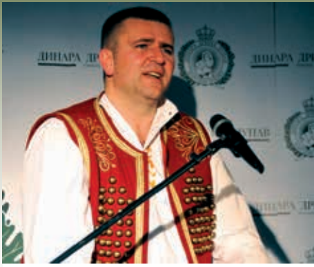
08.11.2013. године Величанствено саборовање Народног покрета Динара-Дрина-Дунав са грађанима Бачке Паланке