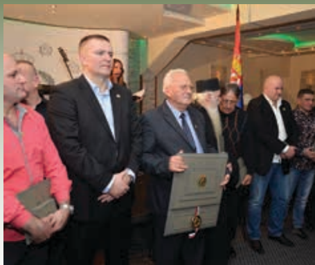
15. фебруар 2014. године ПРОСЛАВА ПРВЕ ГОДИШЊИЦЕ НАРОДНОГ ПОКРЕТА