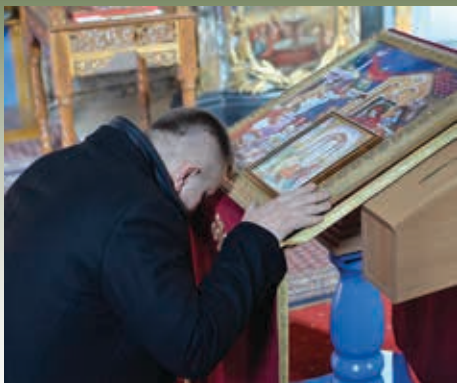
17. фебруар 2014. године Каћ, Срећење Господње